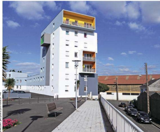
Le projet Ville-Port à Saint-Nazaire redonne vie au quartier délaissé jusque-là.

L'attractivité du territoire s'étirant entre Nantes et Saint-Nazaire n'aura jamais été aussi forte. L'Insee prévoit que, d'ici à 2020, 100 000 personnes supplémentaires viendront gonfler la population de cette zone où vivent déjà 800 000 habitants, dont 90% résident dans les deux principales villes, Nantes et Saint-Nazaire. Si les retraités s'installent sur le littoral, les jeunes actifs et leurs familles se pressent à Nantes et dans sa proche banlieue, attirés tant par le dynamisme économique et culturel de la capitale de l'Ouest que par sa qualité de vie. Reste à absorber cet afflux constant de nouvelles populations en menant de front développement urbain et préservation d'un environnement hypersensible, sachant que 80% de l'aire métropolitaine est composé d'espaces naturels dont 40 000 hectares de zones humides. Pour maîtriser le développement de cet espace estuarien contraint, les élus ont adopté, en 2007, un Schéma de cohérence territoriale (Scot) unique entre les deux villes (1), en englobant les rives sud de l'estuaire et des villes excentrées. Le conseil