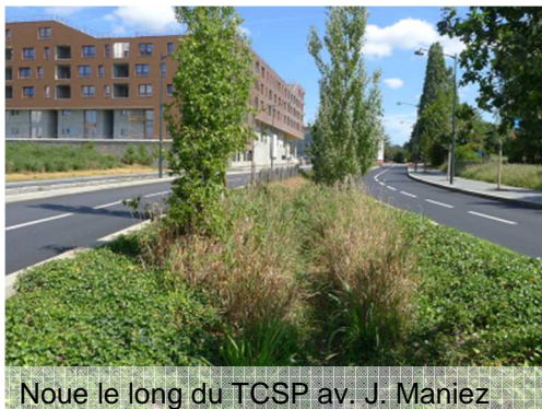
Noue le long du TCSP av. J. Maniez