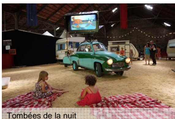
Tombées de la nuit

Des événements et des actions culturelles ont été proposés pour accompagner le projet urbain. L'association Courrouze AA a ainsi été créée pour organiser des événements d'échelles métropolitaines (participation aux tombées de la Nuit de 2013) ou locales (pique-niques festifs...).