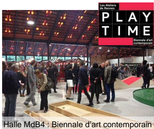
Halle MdB4 : Biennale d'art contemporain

Un travail de mémoire a été effectué avec les associations des anciens ouvriers des chantiers d'armement. Des vestiges du passé industriel sont préservés et valorisés. Une halle industrielle a été réhabilitée en équipement polyvalent. Elle a déjà pu accueillir Play Time, la biennale d'Art Contemporain 2014 de Rennes. Un mémorial à l'attention des victimes du dernier convoi de déportés du 2 août 1945 est érigé et sera inauguré cette année. Les quais, les rails, le mur d'enceinte, les bassins... sont utilisés dans le projet d'espace public et construisent le paysage de la Courrouze.