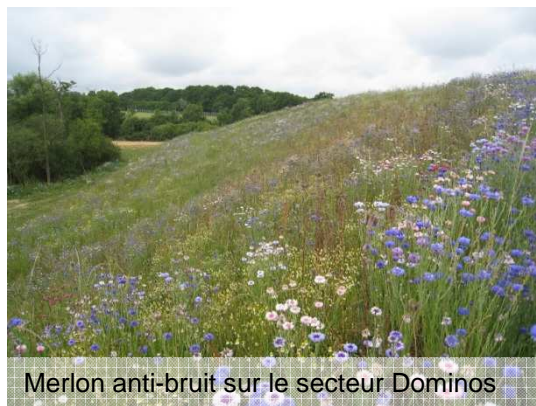
Merlon anti-bruit sur le secteur Dominos

Lorsque l'activité industrielle n'est pas source de patrimoine, elle est appréciée en tant que ressource potentielle. Les bétons issus des démolitions ont notamment été réutilisés en tant que matériau de construction dans les structures de chaussée. Les terres, non inertes mais faiblement pollués, ont été stockées en merlon pour se protéger du bruit de la rocade, participer au paysage et limiter l'impact écologique lié au transport des matériaux en décharges.