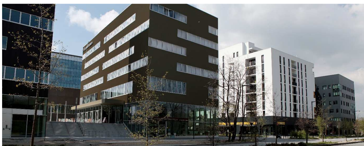
Secteur Dominos

Au sud-ouest de Rennes et au cœur de la métropole, à cheval sur les communes de Rennes et de Saint-Jacques-de-la-Lande, l'EcoQuartier de la Courrouze est la première opération communautaire. Lancée au début des années 2000, puis engagé par une Zone d'Aménagement Concerté en 2003, le projet urbain est en phase de réalisation depuis 2006. A terme, quelques 10 000 habitants et 3 000 emplois sont prévus.