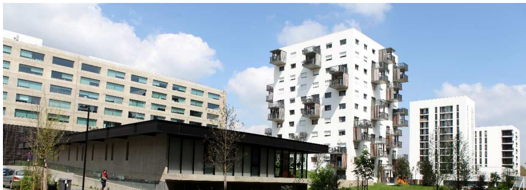
Siège social Legendre, crèche et logements sur Dominos

Concernant les logements, la diversité programmatique est appliquée sur chaque secteur. On retrouve ainsi sur tout le territoire de de la Courrouze et réparti de manière homogène :