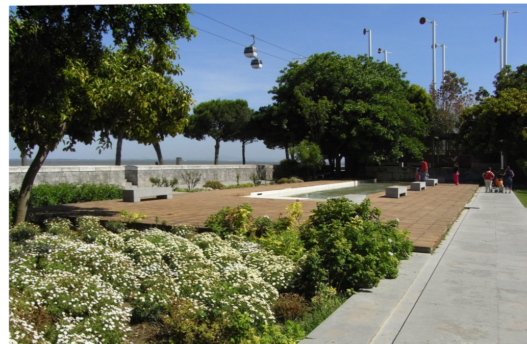
Jardins Garcia de Orta, Parque das Nações, Lisboa

e Natural ( Convenção de Paris ), aprovada pela Organização das Nações Unidas para a Educação, Ciência e Cultura (UNESCO) em 1972 e ratificada por Portugal pelo Decreto n.º 49/79, de 6 de junho, que define as bases e princípios da conservação do património mundial natural e cultural, tendo sido os critérios de inclusão na Lista do Património Mundial revistos em 1992, de acordo com a proposta elaborada conjuntamente pelo ICOMOS e pela União Internacional para a Conservação da Natureza (UICN); (iii) a Carta de Florença sobre a Salvaguarda de Jardins Históricos , elaborada em 1981 pela Comissão Internacional de Jardins Históricos ICOMOS-IFLA e que consagra, pela primeira vez, o valor cultural de construções humanas em que são utilizados materiais vivos; (iv) a Convenção para a Salvaguarda do Património Arquitetónico Europeu (Convenção de Granada) , aprovada em 1985 pelo Conselho de Europa e ratificada por Portugal pela Resolução da Assembleia da República n.º 5/91, de 23 de janeiro, onde se estabelecem três categorias para o património arquitetónico – monumentos, conjuntos e sítios e (v) a Convenção sobre o Valor do Património Cultural para