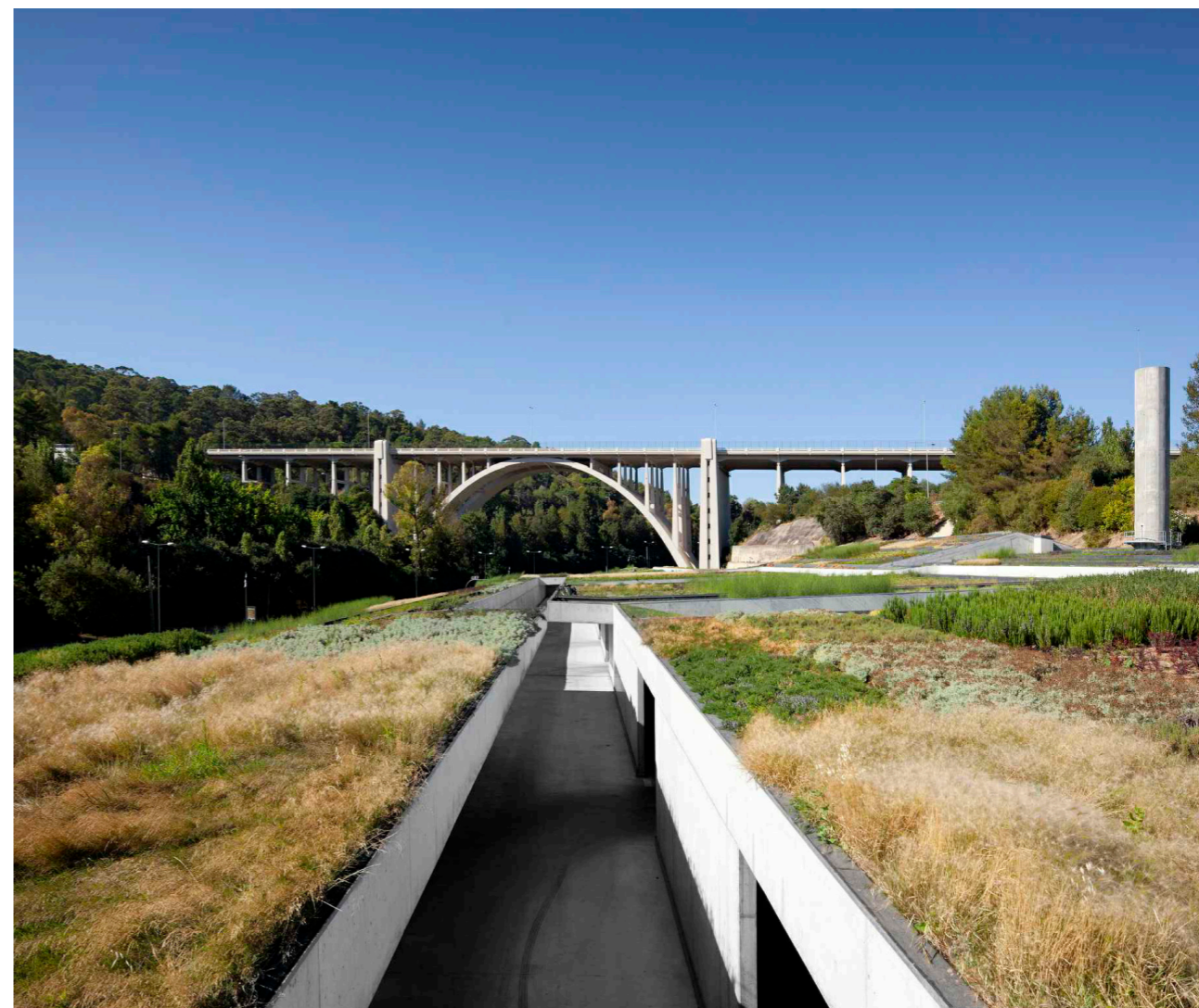
ETAR de Alcântara, Lisboa

lientes, recuperando e adequando técnicas e ensinamentos ancestrais. A intervenção na Paisagem promovendo a sua multifuncionalidade, assegurando o provimento de serviços ambientais sem descuidar a sua função económica, social, recreativa e cultural, bem como a sua qualidade visual, indo ao encontro das soluções mais adequadas às características e especificidades dos lugares, e mais eficientes e duradouras para o bem-estar presente e futuro das populações. Sempre que a sustentabilidade dos recursos é respeitada e que, num quadro de responsabilidade ambiental, as necessidades do Homem são satisfeitas, a Arquitetura e a Paisagem concorrem para o valor e a qualidade ambiental.