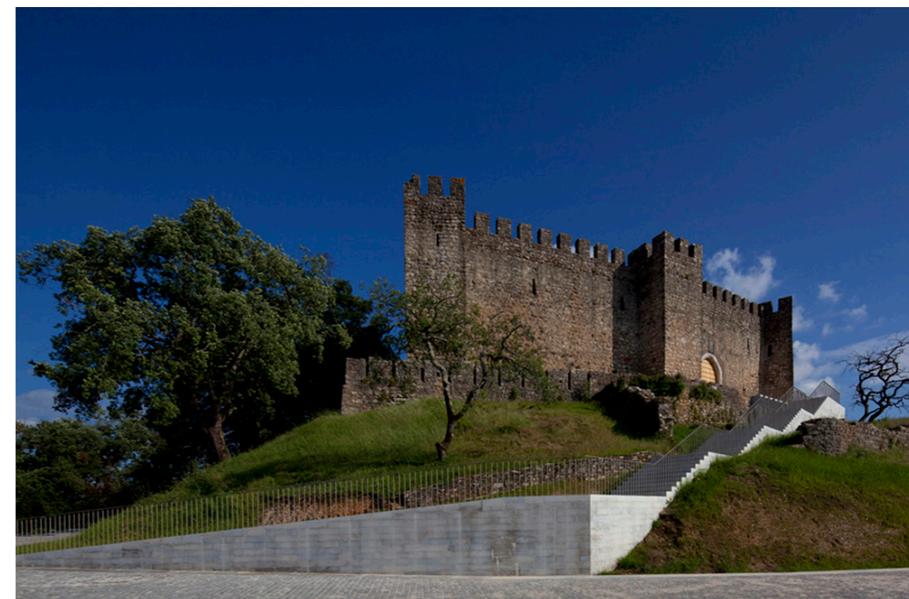
Encosta do Castelo, Pombal

há muito um dos problemas apontados, afetando a eficácia das políticas territoriais, a qualidade e eficiência do sistema de planeamento e ainda a própria aceitação social das regras impostas aos particulares. Apesar do longo caminho percorrido, que conduziu, depois de décadas de legislação avulsa e contraditória, à publicação, em 1998, da primeira Lei de Bases das Políticas de Ordenamento do Território e Urbanismo e ao alinhamento de um sistema de gestão territorial coordenado e coerente, persistem deficiências que, não obstante os esforços continuados para aumentar a transparência e simplificar procedimentos, contribuem para descredibilizar a imagem pública do ordenamento do território em Portugal.