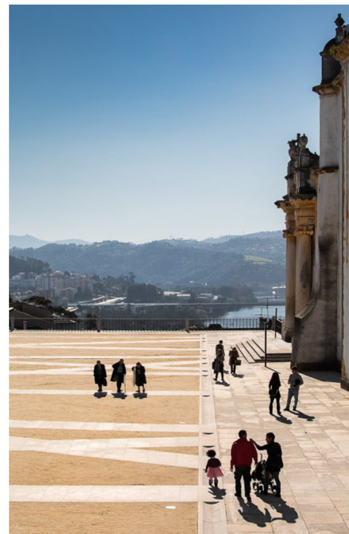
Pátio das Escolas, Coimbra

Com base neste entendimento, a opção passa por integrar a Arquitetura e a Paisagem numa mesma política pública, que considerando as dimensões e especificidades próprias de cada um destes domínios, procura observar e valorizar os aspetos, os princípios e esferas de atuação que têm em comum. A Política Nacional de Arquitetura e Paisagem é, pois, uma política de carácter transversal, não apenas pela ênfase que é colocada nas sinergias existentes entre a Arquitetura e a Paisagem com vista à prossecução de objetivos partilhados, mas também e sobretudo porque, atendendo à natureza transversal dos domínios em questão, deve ser considerada e integrada nas demais políticas setoriais com impacto no quadro de vida, no bem-estar e qualidade de vida das populações.