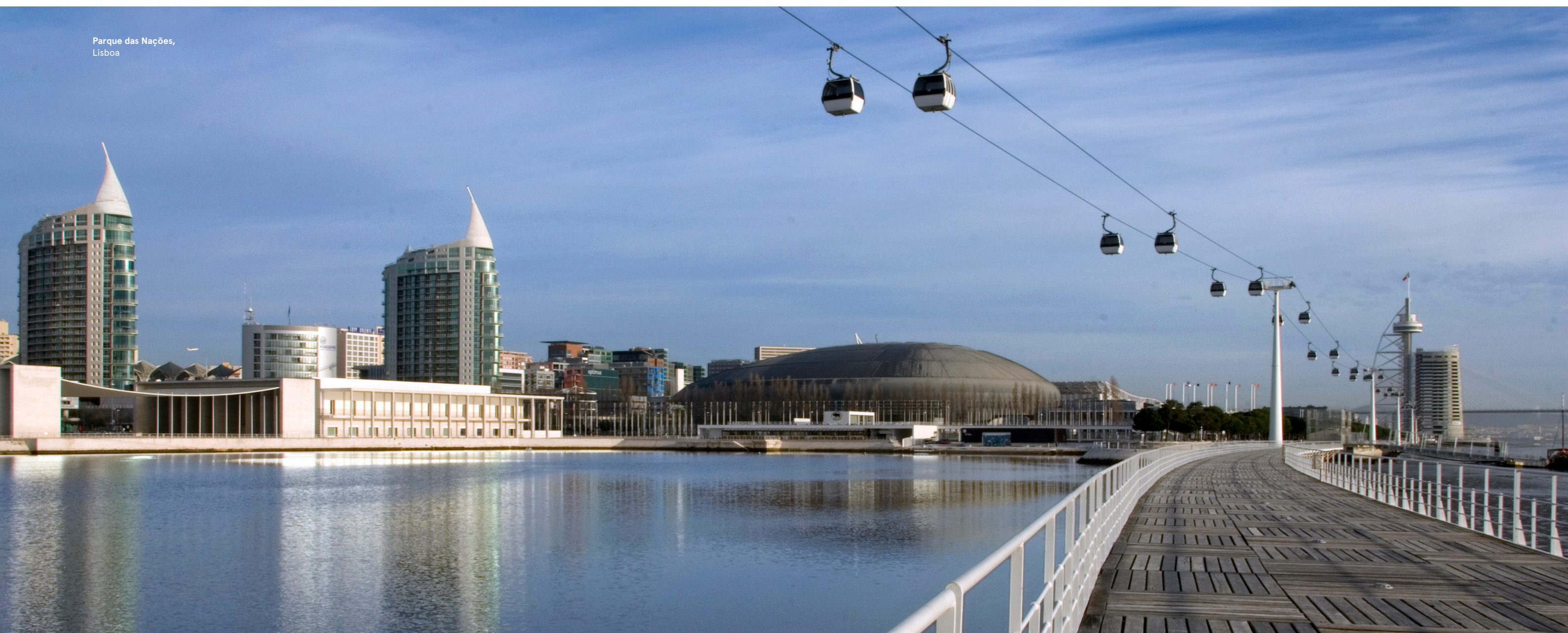
Parque das Nações, Lisboa